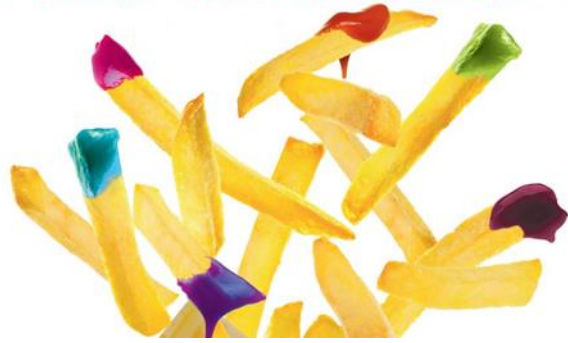
Affiche Campagne de communication